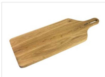
nh 086 VE 2 65.00 39 x 20, H 1.5 cm Schneide-, Servierbrett Paddleboard M Planche à découper, à servir Paddleboard M