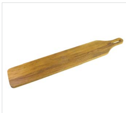
nh 084 VE 2 44.00 67 x 12, H 1.5 cm Schneide-, Servierbrett Paddleboard Long Planche à découper, à servir Paddleboard Long