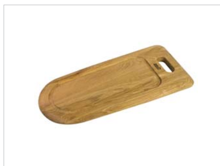
nh 089 VE 2 59.00 40 x 19, H 2 cm Schneide-, Servierbrett mit Safrinne S Planche à découper, à servir avec rigole S