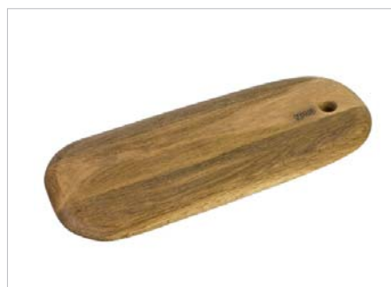
nh 095 VE 2 44.00 38.5 x 16.6, H 2 cm Schneidebrett Surf S Planche à découper Surf S