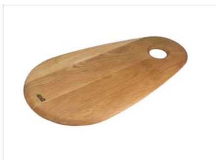
nh 114 a VE 2 75.00 42 x 25 cm, H 2 cm Schneidebrett Teardrop S Planche à découper Teardrop S