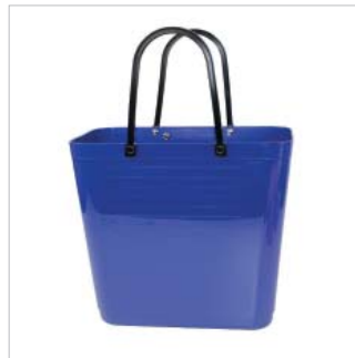
PD55309 VE 2 59.00/Stk 34 x 18 cm, H 30 cm, mit Henkel 47 cm blau/bleu