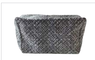
PD45199 VE 1 39.00/Stk 34 x 18 cm, H 30 cm virrvarr black/white