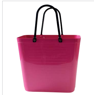
PD55305 VE 2 59.00/Stk 34 x 18 cm, H 30 cm, mit Henkel 47 cm pink