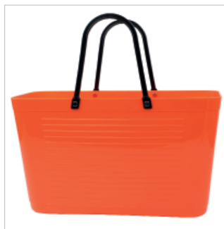
PD195004 VE 2 39.00/Stk 43 x 18 cm, H 24 cm, mit Henkel 41.5 cm orange