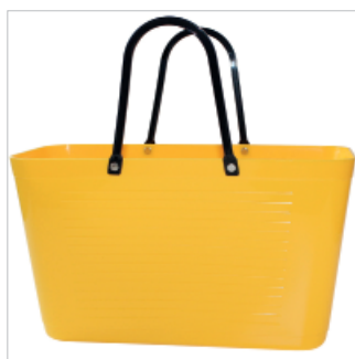
PD195015 VE 2 39.00/Stk 43 x 18 cm, H 24 cm, mit Henkel 41.5 cm gelb/jaune