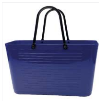
PD195009 VE 2 39.00/Stk 43 x 18 cm, H 24 cm, mit Henkel 41.5 cm blau/bleu