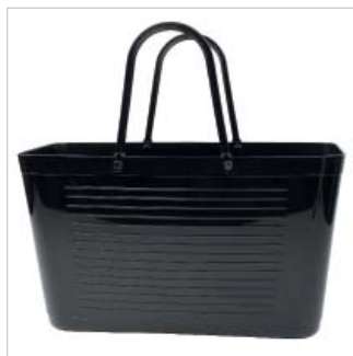
PD195001 VE 2 39.00/Stk 43 x 18 cm, H 24 cm, mit Henkel 41.5 cm schwarz/noir

Volume: 15 litres, max. poids de transport 15 kg.