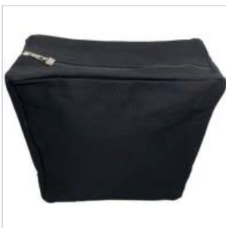
PD45301 VE 1 39.00/Stk 34 x 18 cm, H 30 cm schwarz/noir