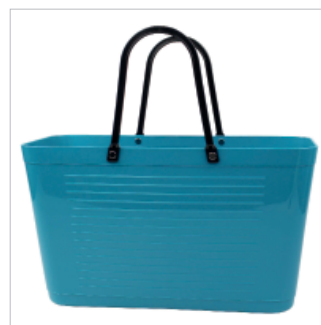
PD195011 VE 2 39.00/Stk 43 x 18 cm, H 24 cm, mit Henkel 41.5 cm türkis/turquoise