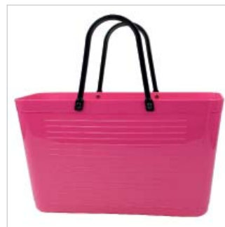
PD195005 VE 2 39.00/Stk 43 x 18 cm, H 24 cm, mit Henkel 41.5 cm pink