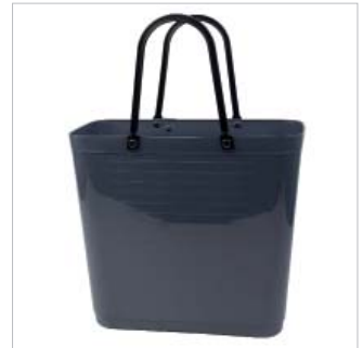
PD55307 VE 2 59.00/Stk 34 x 18 cm, H 30 cm, mit Henkel 47 cm grau/gris