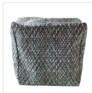
PD45399 VE 1 39.00/Stk 34 x 18 cm virrvarr black/white