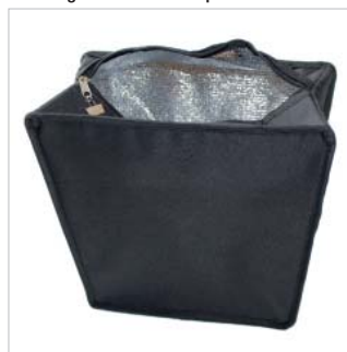
Coolbag - Innentasche - pochette isotherme