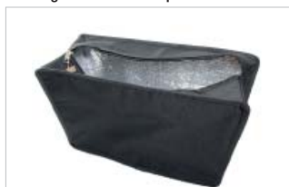
PD49101 VE 1 39.00/Stk 34 x 18 cm, H 30 cm schwarz/noir