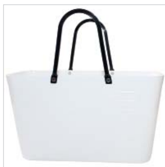
PD195008 VE 2 39.00/Stk 43 x 18 cm, H 24 cm, mit Henkel 41.5 cm weiss/blanc