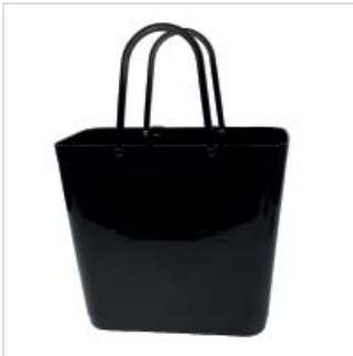
PD55301 VE 2 59.00/Stk 34 x 18 cm, H 30 cm, mit Henkel 47 cm schwarz/noir

Volume: 15 litres, max. poids de transport 15 kg.