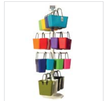
PD-Dis leer ohne Taschen 450.00 bleibt Eigentum von M&B 82 x 82 cm, H 210 cm