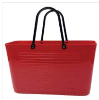
PD195002 VE 2 39.00/Stk 43 x 18 cm, H 24 cm, mit Henkel 41.5 cm rot/rouge