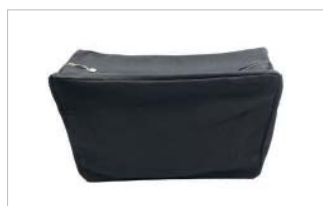
PD48101 VE 1 39.00/Stk 34 x 18 cm, H 30 cm schwarz/noir