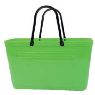
PD195012 VE 2 39.00/Stk 43 x 18 cm, H 24 cm, mit Henkel 41.5 cm apfelgrün/vert pomme