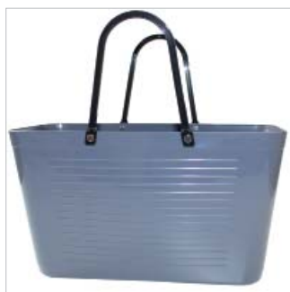
PD195007 VE 2 39.00/Stk 43 x 18 cm, H 24 cm, mit Henkel 41.5 cm grau/gris