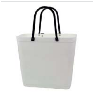
PD55308 VE 2 59.00/Stk 34 x 18 cm, H 30 cm, mit Henkel 47 cm weiss/blanc