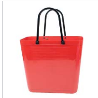
PD55302 VE 2 59.00/Stk 34 x 18 cm, H 30 cm, mit Henkel 47 cm rot/rouge