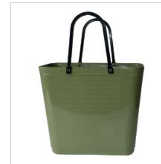
PD55318 VE 2 59.00/Stk 34 x 18 cm, H 30 cm, mit Henkel 47 cm grün/vert