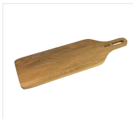
nh 085 VE 2 44.00 34 x 15, H 1.5 cm Schneide-, Servierbrett Paddleboard S Planche à découper, à servir Paddleboard S