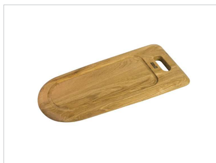
nh 089 VE 2 59.00 40 x 19, H 2 cm Schneide-, Servierbrett mit Safrinne S Planche à découper, à servir avec rigole S