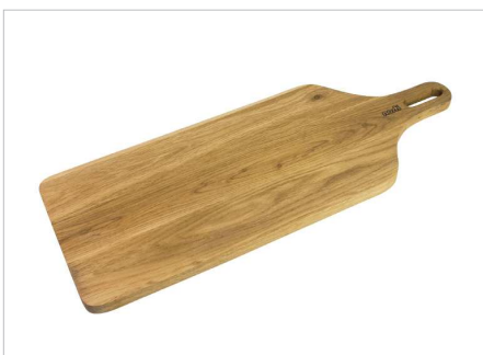
nh 086 VE 2 65.00 39 x 20, H 1.5 cm Schneide-, Servierbrett Paddleboard M Planche à découper, à servir Paddleboard M