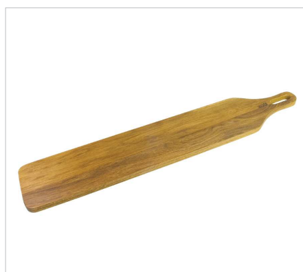
nh 084 VE 2 44.00 67 x 12, H 1.5 cm Schneide-, Servierbrett Paddleboard Long Planche à découper, à servir Paddleboard Long