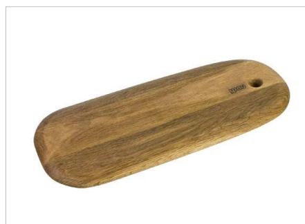
nh 095 VE 2 44.00 38.5 x 16.6, H 2 cm Schneidebrett Surf S Planche à découper Surf S