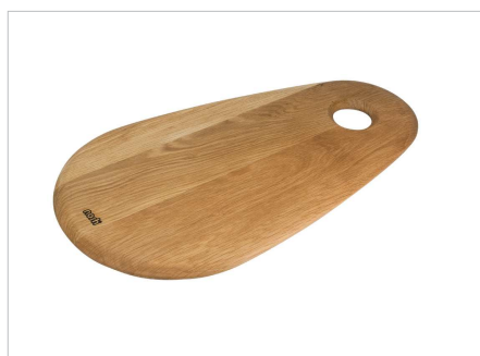
nh 114 a VE 2 75.00 42 x 25 cm, H 2 cm Schneidebrett Teardrop S Planche à découper Teardrop S