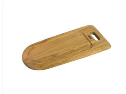
nh 089 VE 2 59.00 40 x 19, H 2 cm Schneide-, Servierbrett mit Safrinne S Planche à découper, à servir avec rigole S