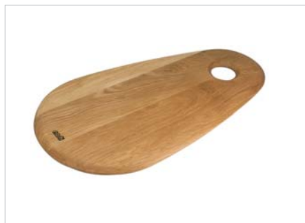
nh 114 a VE 2 75.00 42 x 25 cm, H 2 cm Schneidebrett Teardrop S Planche à découper Teardrop S