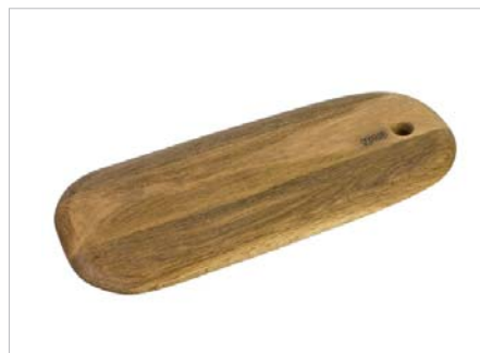
nh 095 VE 2 44.00 38.5 x 16.6, H 2 cm Schneidebrett Surf S Planche à découper Surf S