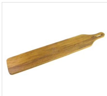
nh 084 VE 2 44.00 67 x 12, H 1.5 cm Schneide-, Servierbrett Paddleboard Long Planche à découper, à servir Paddleboard Long