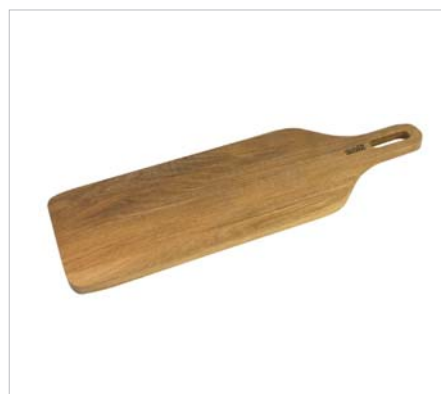
nh 085 VE 2 44.00 34 x 15, H 1.5 cm Schneide-, Servierbrett Paddleboard S Planche à découper, à servir Paddleboard S