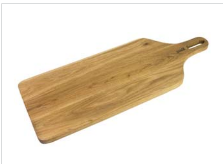
nh 086 VE 2 65.00 39 x 20, H 1.5 cm Schneide-, Servierbrett Paddleboard M Planche à découper, à servir Paddleboard M