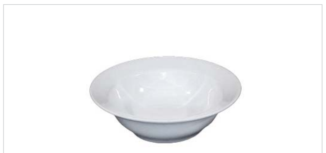
Schüssel Etrusca - Saladier Etrusca