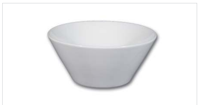
Schüssel konisch Napoli - Saladier conique Napoli