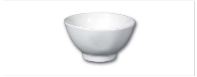
Bowl Japan Tivoli - Bol Japan Tivoli