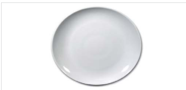
Steakteller Tivoli - Assiette à steak Tivoli