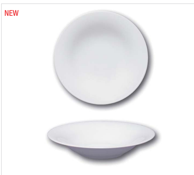
Pastateller Gourmet Napoli - Assiette gourmandise