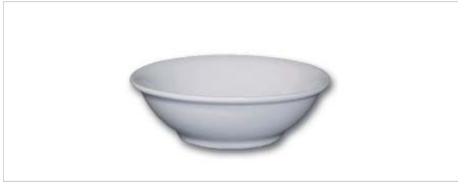
Schüssel calotta Tivoli - Coupelle calotta Tivoli